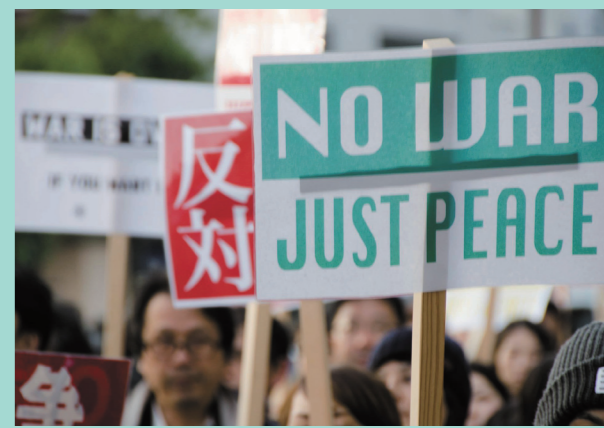
安保法制廃止のデモにも参加しています。

武力の使用や武力の誇示で国際平和を維持しようという考え方は時代遅れであり、外交と対話で平和をつくっていかうとする国際社会の努力に水をさすものです。