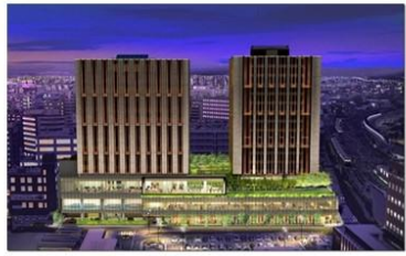
2016年12月 外資系ホテル誘致に関し駅西口を視察