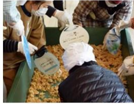
2016年2月地域の味噌作りに参加