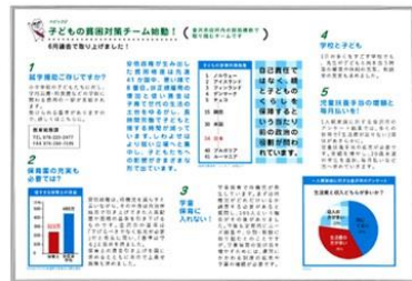
みよみよ通信発行