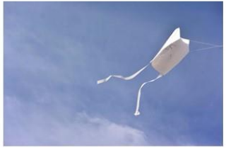
金沢市学童保育市連協のイベントに参加