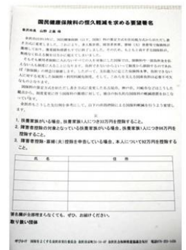
国民健康保険料軽減を求める署名も開始