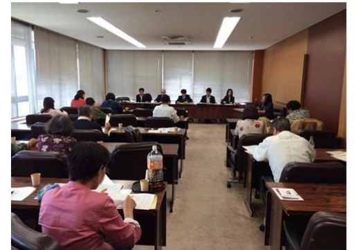
2017年5月 保護者や教育関係のみなさんと教育予算の拡充、修学援助制度の改善の申し入れ