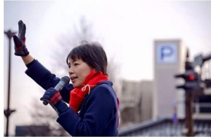
2017年 1月2日 新春朝宣伝