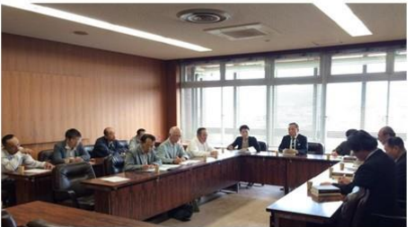
2017年5月「生活と健康を守る会」のみなさんと生活保護の引き下げ中止などの申し入れ