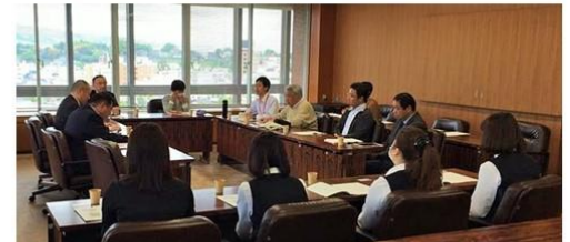
2017年5月 「金沢市の国民健康保険をよくする会」のみなさんと申し入れ

就学援助制度の入学準備金の前倒し支給が決定！ 新入学生1200人が、8月から3月に支給され、補助単価も増加。 みなさんと取り組んだ待ちに待った要求が実現しました。