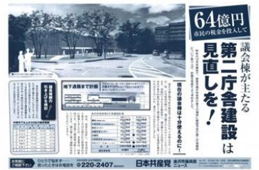
第二庁舎建設の見直しについても声が高まる

議員報酬について、わが共産党を除くすべての会派の意向により「引き上げ」という見直し方向で、市長に申し入れを文章がまとまる。