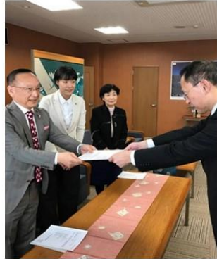
みよみよ通信 発行